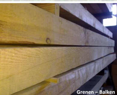
Grenen – Balken