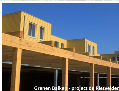
Grenen Balken - project de Rietvelden