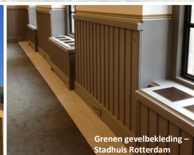
Grenen gevelbekleding – Stadhuis Rotterdam