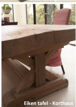
Eiken tafel - Korthaus