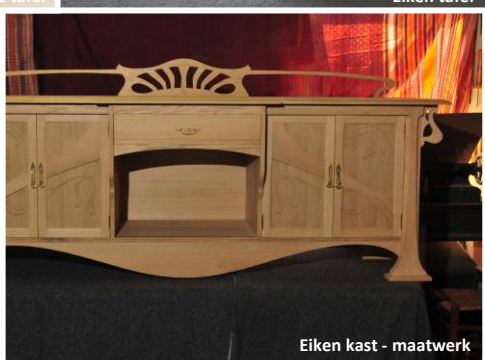
Eiken kast - maatwerk