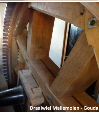
Draaiwiel Mallemolen - Gouda