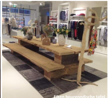
Eiken bourgondische tafel