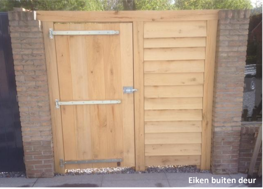
Eiken buiten deur