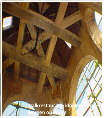
Balkrestauratie klokkentoren - Bergen op Zoom