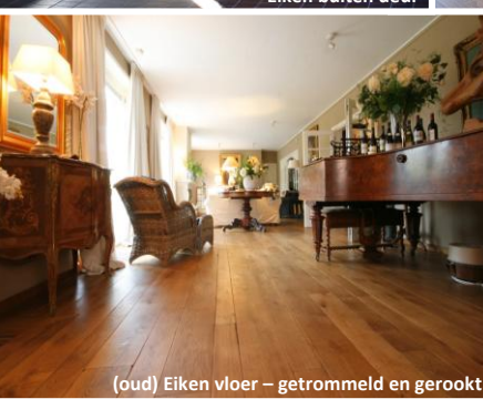
(oud) Eiken vloer – getrommeld en geroekt