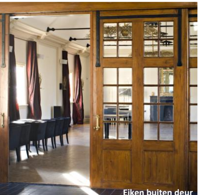
Eiken buiten deur