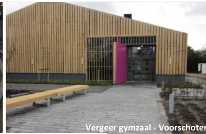
Vergeer gymzaal - Voorschoten