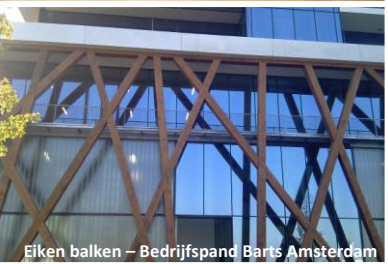
Eiken balken – Bedrijfspann Barts Amsterdam