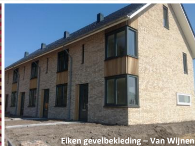
Eiken gevelbekleding – Van Wijnen