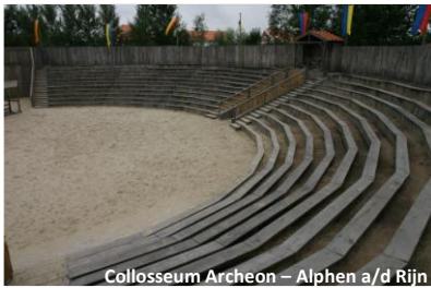
Colosseum Archeon – Alphen a/d Rijn