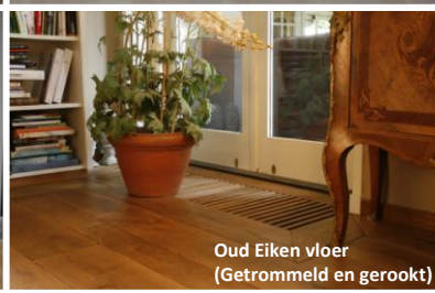
Oud Eiken vloer (Getrommeld en gerookt)