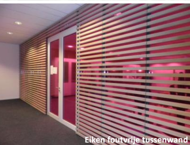
Eiken foutvrije tussenwand