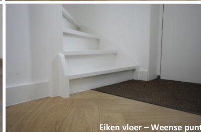
Eiken vloer – Weense punt