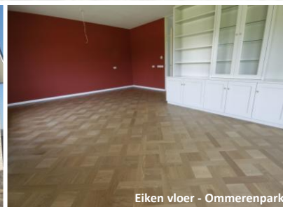
Eiken vloer - Ommerenpark