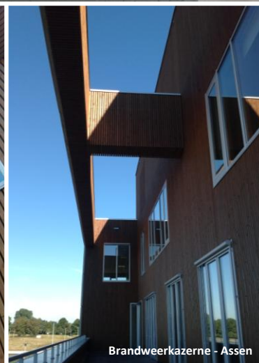
Brandweerkazerne - Assen