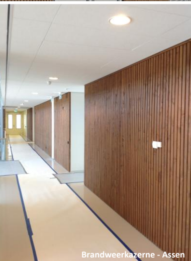
Brandweerkazerne - Assen